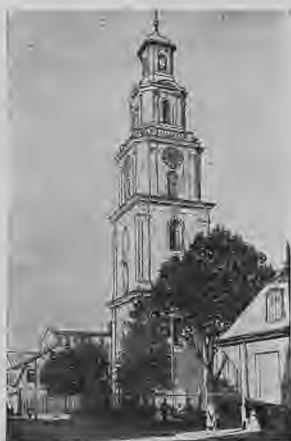
(Trīsvienības) Vācu baznīca.

kur Liepājas ezers pie Pērkones rada dziļu līci, kuru izlietoja kuršu un skandināviešu jūras braucēji. Pirmo reizi vēsturē šis ciems ir minēts 1253. g. un ap 1300. g. tur apmetušies pirmie vācu tirgotāji. Pirmais Liepājas nosaukums bija latīnisks — Liva portus, pēc tam Liba un tikai vēlākā laikā to sauca par Libau un Liepāju. Leiši un kurši bieži uzbruka neaizsargātam ciemam