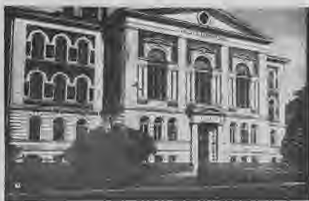
Valsts Liepājas Technikums.

bināja pirmo drukātavu 1823. g. un 1824. g. sāka iznākt vācu nedēļas avīze. 1830. g. nodibināja slimnīcu, 1861. g. — ģimnāziju, 1869. g. — telegrafa kabeli uz Kopenhagenu, 1872. g. atvēra valsts bankas filiāli, 1875. g. atklāja kūrmaiju, 1877. g. — jūrskolu, 1878. g. pirmo reizi iebrauca vairāk kā 1000 kuģu gada laikā, 1880. g. nodibināja biržu un gāzes iestādi, 1881. g. atvēra realskolu, 1883. g. atklāja dzelzs ostas tiltu, 1885. g. — Nikolaja ģimnāziju, 1899. g. atklāja elektrisko ielas dzelzceļu, 1899. g. un 1900. g. atklā-