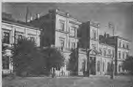
Liepājas galv. stacija.

Liepājas apriņķis atrodas Kurzemes dienvidus vakaru trīsstūrī. Liepājas apriņķis sākās ziemeļos no Sventajas grīvas uz Lietavas robežas un to ierobežo Lietava, Baltijas jūra (93 km.) un Aizputes apriņķis, tas ir 2584,3 klm. liels. Šo apriņķi agrāk sauca par Grobiņas apriņķi, jo visas apriņķa pārvaldes iestādes atradās Grobiņā,