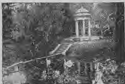
Gulbju diķis apstādījumos.

dokiem un vienu peldošu doku, sausajiem dokiem ir 45.000 klm. ūdens tilpums, 1925. g. beigās tur strādāja 469 strādnieki (ražojumu vērtība bija 1.890.243 Ls). Tad vēl pelna ievēribu Ziem. Vakarū mef. mechaniskā fabrika ar 856 strādņ. (3,6 milj. Ls raž. vērtību), satiksmes ministrijas darbnīcas ar 754 strādņ., A.-S. „Vulkan“ sērkočinu fabr. — 268 strādņ., Liepājas korķu un līnoleuma fabr., kurā pašlaik strādā ļoti mazā mērā, Liepājas Aizputes dzelzceļa darbnīcas — 152 strādņ., Kielera eļļas fabr. — 100 strādņ., Berendta