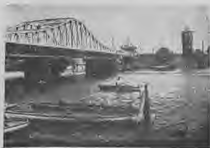
Dzelztilts pār ostu.

1920. g. to pārdēvēja par Liepājas aprinķi. Šis aprinķis atrodas mežainā un mazauglīgā apvidū, bet pateicoties tam, ka saimniecības tur ir nelielas, un ka daudziem iedzīvotājiem Liepājas pilsēta un jūras tuvums sniedz blakus peļņu, tas tomēr ir diezgan daudz apdzīvots. Liepājas aprinķī atrodas 3 pilsētas, viens miests un 69 ciemi, vai sādžveidīgi māju sakopojumi. Grobiņas pagastā atrodas 17 ciemi, Dunikas — 13, Pērkones — 4, Rucavas — 24 un Nicas — 11. Aprinķis