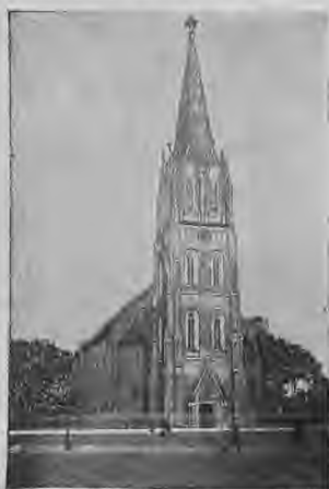
Sv. Annas baznīca.

Brandenburgas princesi. Liepāja daudz cieta no kara briesmām, ugunsgrēkiem un mēra, laikā no 1655. g. līdz 1716. g. Vienā pašā Liepājas Latviešu draudzē 1710. g. ir miruši no mēra 5000 cilvēki. Ziemeļu kara laikā pilsētai bija jāmaksā 100000 guldenu kontribūcijas naudā un tikpat daudz naturalijās. Liepāja palika bez ostas, agrākai ostai aizsērējot, kaut gan kuģi tur piestāja