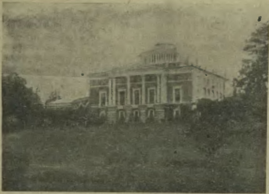
ДВОРЕЦЪ ВЪ Г. ПАВЛОВСКЪ.