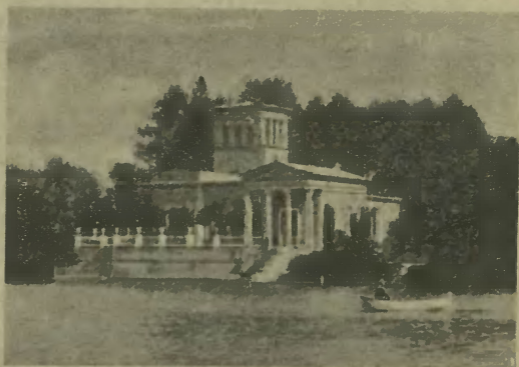
ЦАРИЦЫНЪ ПАВИЛЬОНЪ ВЪ Г. ПЕТЕРГОФѢ

Прежде чѣмъ ѣхать осматривать достопримѣчательности окрестностей города рекомендуемъ ознакомиться съ содержаніемъ книги „Путеводитель по окрестностямъ города Петербурга“. Изданіе А. И. Загряжскаго. Въ этой книгѣ вы найдете подробное описаніе каждой достопримѣчательности въ отдѣльности и съ ней, какъ съ опытнымъ проводникомъ, осмотрите окрестности съ ихъ сокровищами.